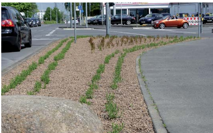
Lavendel und Gräser im neu gestalteten Beet an der Bonner Straße.

An der zentralen Kreuzung Bonner Straße/Hennefer Straße/Arnold-Janssen-Straße wurden mehrere große Pflanzbeete erneuert. Dort wird zukünftig im Sommer der Lavendel violett leuchten und zum Anziehungspunkt für Bienen werden. Auf den Fahrbahnteilern am sogenannten Kumpelkreisel am Ortseingang Menden werden Blühstreifen angelegt.