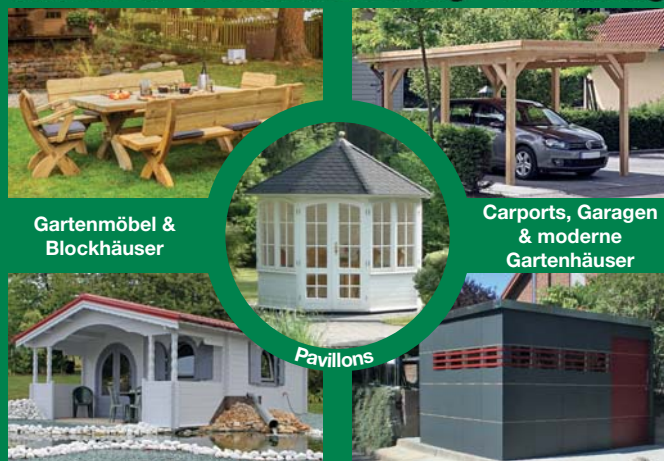
Gartenmöbel & Blockhäuser