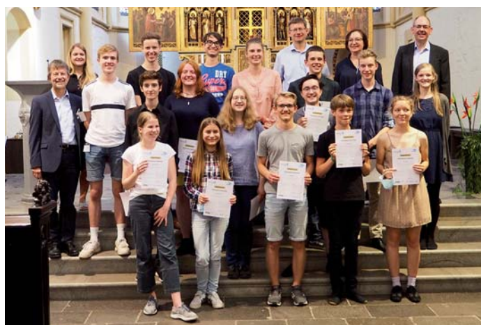
15 Kinder, Jugendliche und junge Erwachsene zwischen 12 und 20 Jahren haben an diesem Orgelprojekt teilgenommen und Wissenswertes rund um die Orgelerfahren.