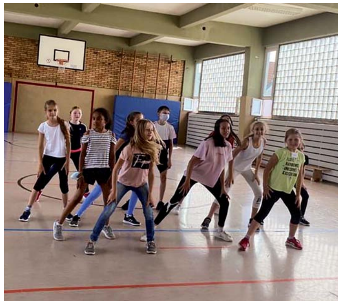
Bei der „Summer School“ stand am Nachmittag sportlicher Ausgleich an, etwa in Musical/Hip-Hop Dance.