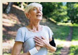
Menschen ab 60 Jahren tun Bewegung an der frischen Luft spürbar gut