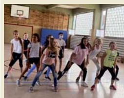
Bei der „Summer School“ stand am Nachmittag sportlicher Ausgleich an: Musical/Hip-Hop Dance