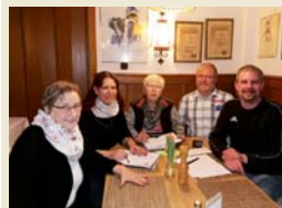
Die Initiative Tschernobyl-Kinder Lohmar e.V. sucht Gasteltern für weißrussische Kinder.