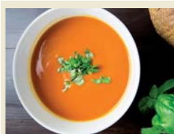
Mitkochen, gewinnen und Gutes tun, heißt es am Sonntag, 22. März