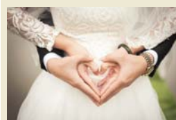
Die hera Hochzeitsmesse findet am zum 6. Mal in der Stadthalle Troisdorf statt