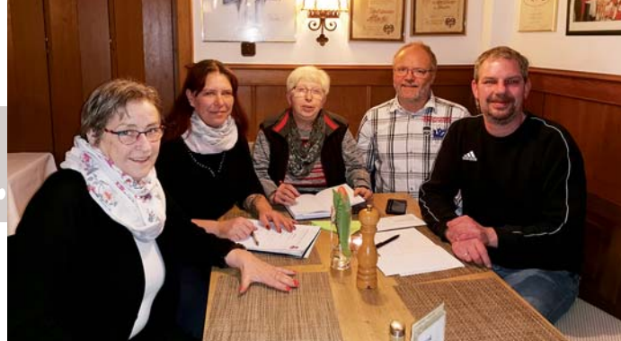
Der Vorstand des Vereins Tschernobyl-Kinder Lohmar e.V. sucht Gasteltern für weißrussische Kinder.