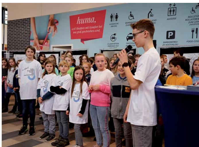
Auch das Kinder- und Jugendparlament Sankt Augustin beteiligte sich an der „Aktion Lieblingsorte“.

Seit über 100 Jahren engagieren sich christliche Frauen über Konfessions- und Ländergrenzen hinweg in der Bewegung des Weltgebetstags. Gemeinsam beten und handeln sie dafür, dass Frauen und Mädchen überall auf der Welt in Frieden, Gerechtigkeit und Würde leben können. So wurde der Weltgebetstag zur größten Basisbewegung christlicher Frauen. Jedes Jahr am ersten Freitag im März organisieren und feiern - zusammen mit Christen in über 120 Ländern - auch Siegburger Frauen den Weltgebetstag. Ökumenisches Miteinander über Kirchengrenzen hinweg wird dabei ganz selbstverständlich gelebt. In diesem Jahr haben Frauen aus Simbabwe den Gottesdienst entworfen, Lieder ausgesucht und Ideen entwickelt. Gastgeber für den Gottesdienst am Freitag, 6. März 2020, um 18.30 Uhr ist die Christusgemeinde Siegburg an der Frankfurter Straße 20. Das aktuelle Motto „Steh auf und geh!“ steht dabei nicht nur für einen Satz aus einer Heilungsgeschichte der Bibel, sondern es spiegelt auch die gesellschaftliche Situation in Simbabwe wieder. So wollen die Frauen aus Simbabwe im Gottesdienst einen Anstoß geben, Wege zu persönlicher und gesellschaftlicher Veränderung zu erkennen und zu gehen, den Blick für die Welt zu weiten und neugierig machen auf Leben und Glauben in anderen Ländern und Kulturen. Auch wenn der Gottesdienst von einem ökumenischen Kreis Siegburger Frauen vorbereitet wurde, sind selbstverständlich auch Männer, Jugendliche und Kinder herzlich zur Teilnahme eingeladen.