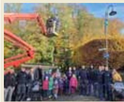
Die Kinder der KiTa „Pauline“ den Dorf-Weihnachtsbaum von Alt-Wolsdorf.