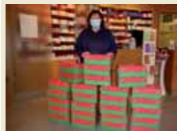
Weihnachtsgeschenke für Kinder, denen es nicht so gut geht