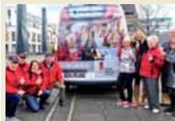
Der neue Bürgerbus der Bürgerstiftung Lohmar