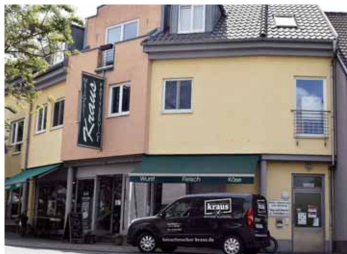
Die Metzgerei Kraus wird heute nach – nach 120 Jahren – am selben Standort betrieben.