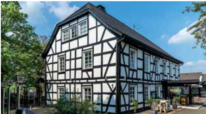
Das ehemalige Nonnen-Kloster der „Schwestern der Liebe vom kostbaren Blut – heute Tapas-Bar Primos

Die Lust auf das deutsche Liedgut war die Initialzündung für 18 Geistinger Bürger, die im Sommer 1874 den MGV Geistingen ins Leben riefen. Während der ersten 25 Jahre des Bestehens ging es aufgrund des häufigen Wechsels von Dirigenten und Vorsitzenden recht turbulent zu. Ein Misserfolg während eines Sängerkonkurrenzwettstreits führte gar zu einer Spaltung des Männerchors, die allerdings nach eineinhalb Jahren wieder rückgängig gemacht wurde. Die erste Blütephase wurde vom Ausbruch des Ersten Weltkriegs unterbrochen. 1924, zum 50-jährigen Bestehen des MGV Geistingen, zählte