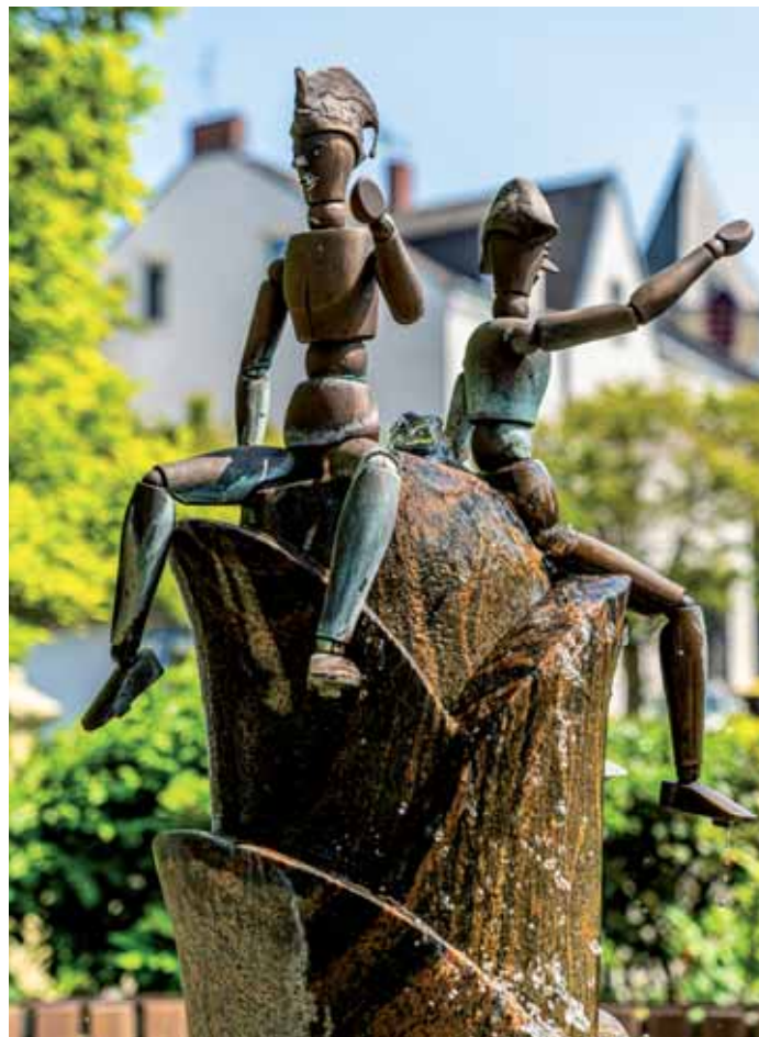
Der Karnevalsbrunnen am Marktplatz