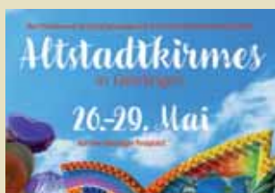
Mir Jeesting Traditionell und modern – der älteste Hennefer Stadtteil