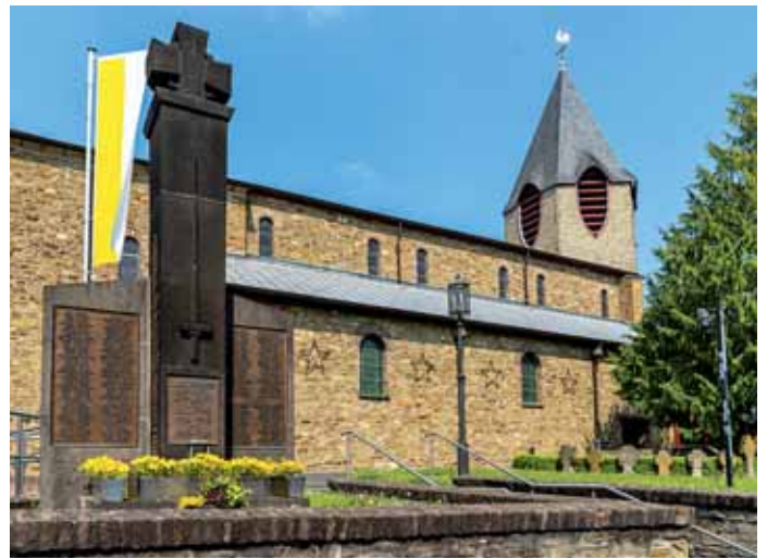
Die Geistinger Pfarrkirche Sankt Michael