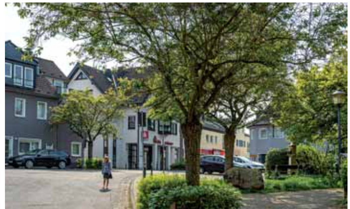
Blick über den Marktplatz