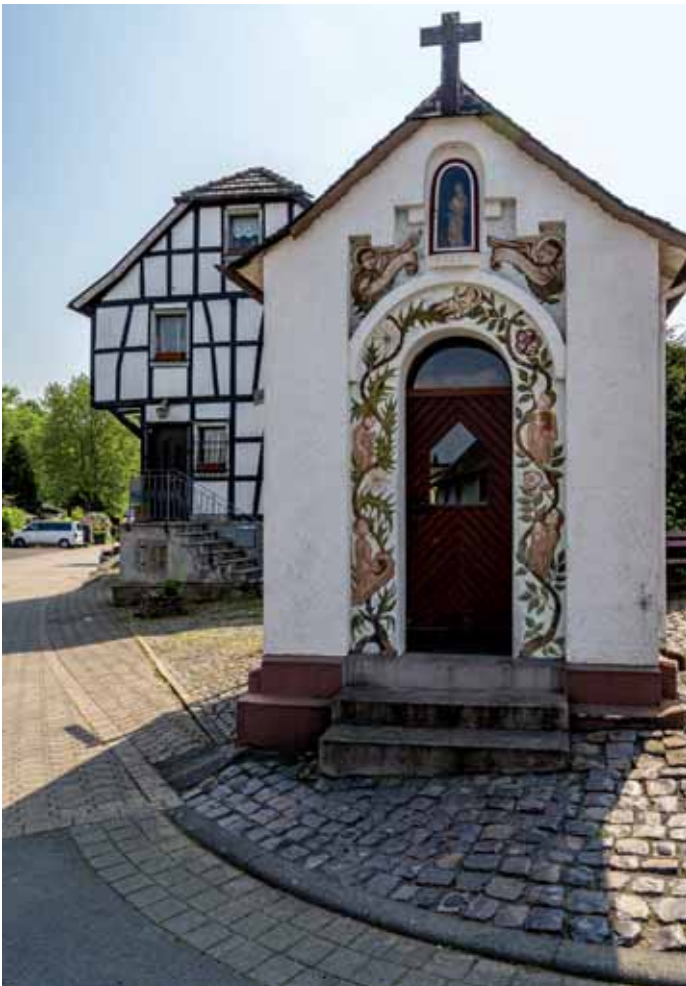
Das Kapellchen an der Bergstraße

Für die Altstadtkirmes haben die acht genannten Vereine des Fördervereins Ortsring Geistingen wieder ein abwechslungsreiches Programm auf die Beine gestellt. Für das Kirmestreiben auf dem Geistinger Platz sorgt ein Autoscooter, für die kleineren Gäste ein Miniscooter und ein Karussell. Geschicklichkeit ist beim Entenangeln gefragt und eine ruhige Hand an der Schießbude. Wer süßes liebt, ist an der Süßwarenstand richtig, deftiges gibt es am Imbiss Radermacher.