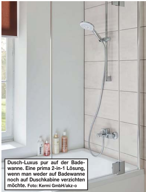
Dusch-Luxus pur auf der Badewanne. Eine prima 2-in-1 Lösung, wenn man weder auf Badewanne noch auf Duschkabine verzichten möchte.

(akz-o) Auch in einer Badewanne lässt es sich komfortabel duschen, ohne dass Wasser nach draußen spritzt. Mit dem Badewannenaufsatz Pasa XP von Kermi wird