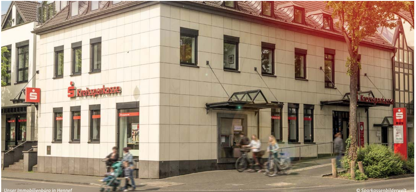
Unser Immobilienbüro in Hennef