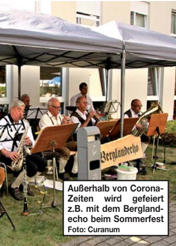
Außerhalb von Corona-Zeiten wird gefeiert z.B. mit dem Berglandecho beim Sommerfest