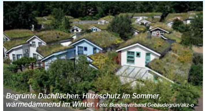
Begrünte Dachflächen: Hitzeschutz im Sommer, wärmedämmend im Winter.