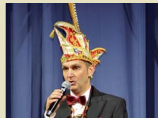
Der Präsident der „Quer durch de Waat“ die erstmals ein Dreigestirn stellt