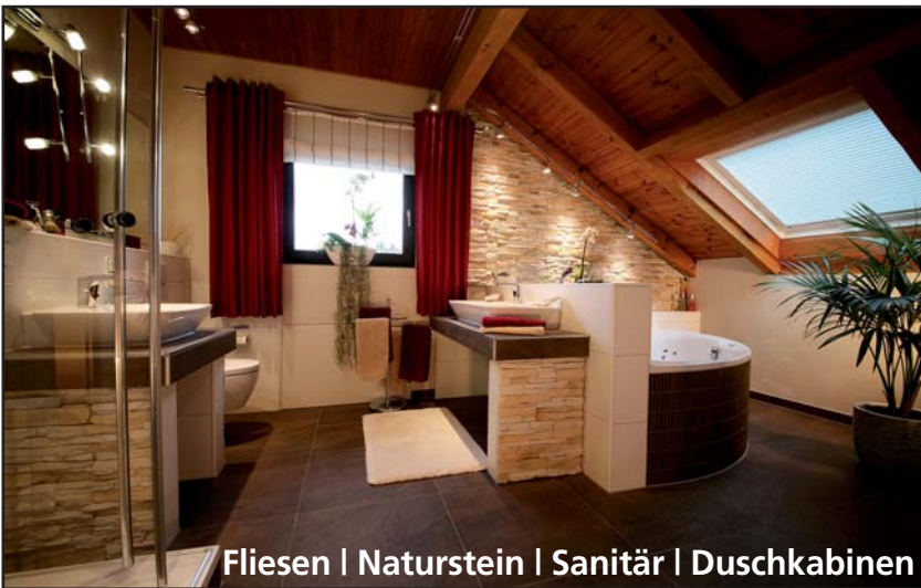
Fliesen | Naturstein | Sanitär | Duschkabinen