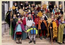
Der Bürgermeister emp- fang die Sternsinger