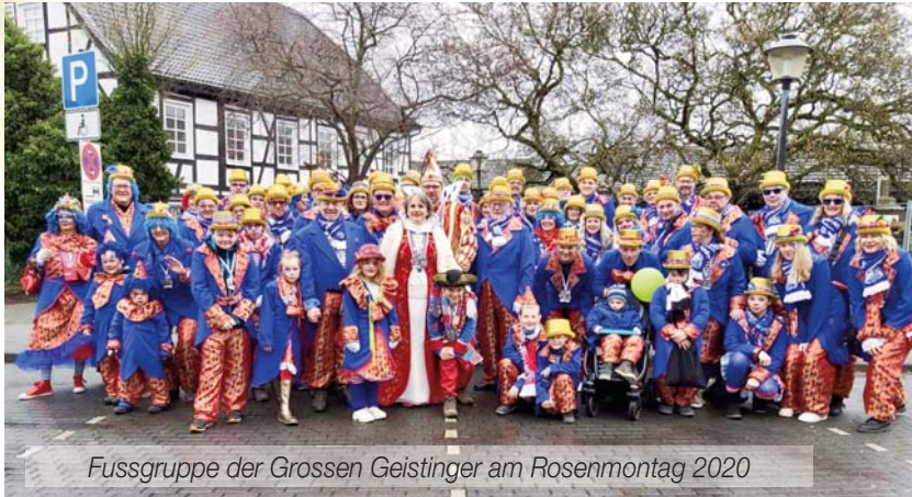
Fussgruppe der Grossen Geister am Rosenmontag 2020

samen Rosenmontagszug durch die Gemeinde. Nach dem 2. Weltkrieg lebten die Aktivitäten unter Präsident Fritz Wolf und dem Vorsitzenden Franz Honnecker wieder auf. Die Gesellschaft nahm jetzt einen raschen Aufschwung, da durch die Währungsreform das Geld wieder etwas wert war. Die Sitzungen der KG wurden zu einem beliebten