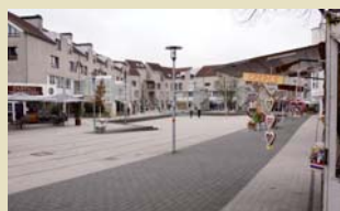
Der Hennefer Marktplatz – Leerstände und vorherr- schende Farbe: ödes Grau