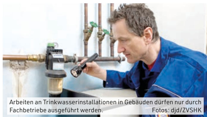
Arbeiten an Trinkwasserinstallationen in Gebäuden dürfen nur durch Fachbetriebe ausgeführt werden.

Frisches Trinkwasser aus der Leitung zählt in Deutschland zu den am besten kontrollierten Lebensmitteln. Es darf fast ausnahmslos ohne Bedenken getrunken werden. Die Wasserwerke können die Qualität des Trinkwassers aber nur bis zum Hausanschluss gewährleisten. Was danach bis zum Wasserhahn geschieht, ist Sache des Eigentümers beziehungsweise Vermieters. Diese sollten ihre Trinkwasserinstallation deshalb regelmäßig von einem geschulten Fachbetrieb überprüfen lassen, Adressen findet man unter www.wasserwaermeluft.de . Auch Trinkwasser hat im Übrigen ein Haltbarkeitsdatum. "Bleibt das Wasser längere Zeit in den Leitungen stehen, können sich Keime vermehren und damit zu einer Minderung der Wasserqualität beitragen", warnt Frank Ebisch vom Zentralverband Sanitär Heizung Klima (ZVSHK). (djd)