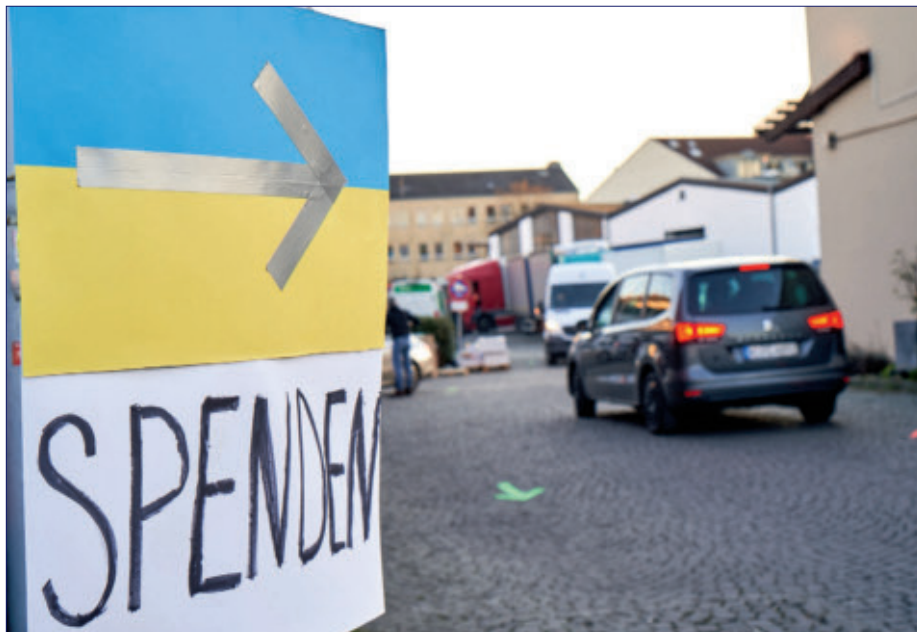
Sachspendenlager des Vereins Blau-Gelbes Kreuz im Kölner Süden. Der Verein ist vielfach auch erste Anlaufstelle für Geflüchtete aus der Ukraine.

Immer mehr Menschen auf der Suche nach Schutz und Unterkunft strömen nach Köln und es ist nicht davon auszugehen, dass sich die Situation bald beruhigen wird. Insgesamt rechnet die Stadt Köln bis März 2023 mit einer Steigerung auf bis zu 15.300 Geflüchtete, die städtisch untergebracht werden müssen. Schließlich hält der russische Angriffskrieg auf die Ukraine weiterhin an. Zudem gibt es