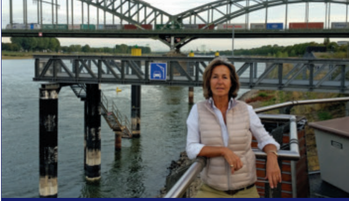
Der Rheinauhafen ist der liebste Ort der Kölner Autorin – sei es zum Schreiben, zur Ideensuche oder zum Abschalten.