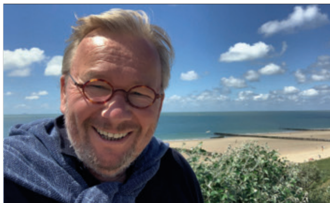
Vor 30 Jahren zog es Bernd Stelter auf einen Campingplatz nach Zeeland. Der Kabarettist und TV-Star ist Fan der beliebten Urlauber-Region in den Niederlanden.

Piet ist völlig überraschend 59, er ist ein bärbeißiger Typ und er hat eine 94-jährige Vermieterin, mit der er am Abend den Fall bespricht. Manchmal ist die alte Dame moderner als er. Und Piet hat ein großes Problem. Es gibt da fünf beklopte deutsche Camper, die immer „mitermitteln“.