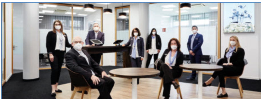
Das Team der Filiale Liblar bietet den Kundinnen und Kunden eine persönliche und individuelle Beratung.

TL: Viele unserer Kunden schätzen die persönliche und individuelle Beratung in einer diskreten und vertrauensvollen Gesprächsatmosphäre. Ich bin überzeugt, dass das auch in Zukunft so sein wird. Gerade bei komplexen Finanzangelegenheiten, wie zum Beispiel der