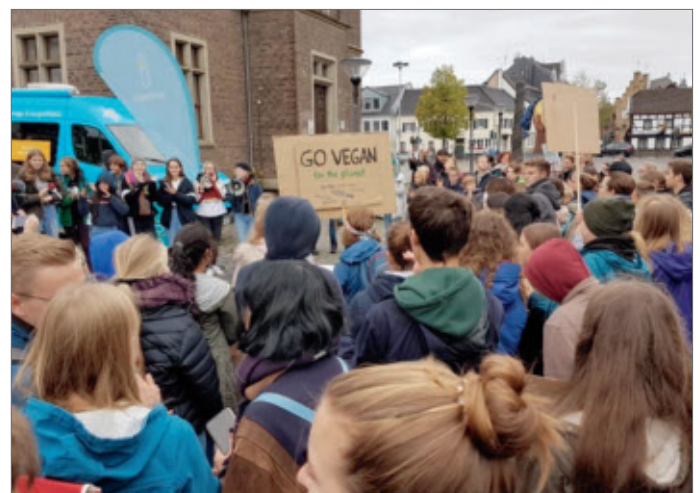
Zusammen zogen sie durch die Ortschaften