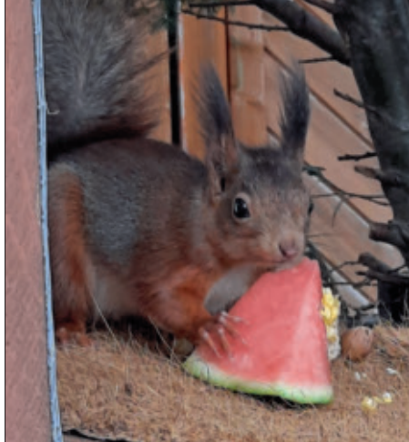
Wassermelonen werden vor allem in der heißen Jahreszeit von Eichhörnchen geliebt.

chen sie jedoch die Nähe von Menschen, dann können sie sich selbst nicht helfen und sind verzweifelt.