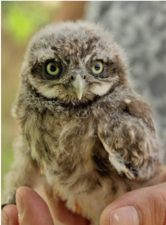
Der Schutz des Steinkauzes ist eines der vielen erfolgreichen NABU-Projekte

nutzt werden", betont Vorsitzender Wolfgang Dingarten. Für die Landwirtschaft bedeute dies eine naturschonende Bewirtschaftung. Im Siedlungsbereich sollen stärker stadtökologische Belange berücksichtigt werden. Heute noch naturnahe Gebiete im Rhein-Erft-Kreis müssten dringend erhalten und angemessen weiterentwickelt werden. Als Grundlage für einen schonenden Umgang mit der Landschaft und dem Schutz seltener Arten beteiligt sich der NABU an Untersuchungen der Tier- und Pflanzenwelt im Kreis. In bei-