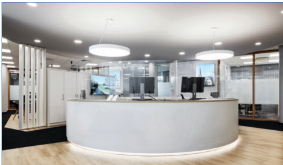
Der Empfangsbereich wurde mit einer Bedieninsel komplett neu gestaltet.

Für die Kunden gibt es einen freundlichen Wartebereich mit gemütlichen Möbeln, einer Tee- und Kaffeeküche sowie einem Großmonitor und zwei Tablets. In dem Bereich erläutern die Mitarbeiterinnen und Mitarbeiter den Kunden unter anderem die Funktionalitäten der Online-Filiale und führen sie in das Onlinebanking der Volksbank ein. Außerdem wurde ein Videoberatungsraum geschaffen, in dem die Mitarbeiterinnen und Mitarbeiter in Zukunft ihre Kunden auch auf diesem Kanal beraten können.