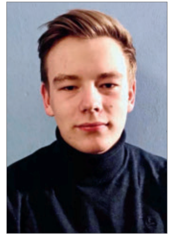
Felix nahm Abstand - auch wegen Corona

Am 25. September 2020 nahm die 19-Jährige am Globalen Klimastreik in Köln teil, während der Corona-Pandemie. An der Demonstration beteiligten sich 10.000 Menschen, Nele war skeptisch. „Ich habe lange überlegt, ob ich da überhaupt hingehen soll, weil ich mir schon dachte, dass viele Menschen kommen werden.“