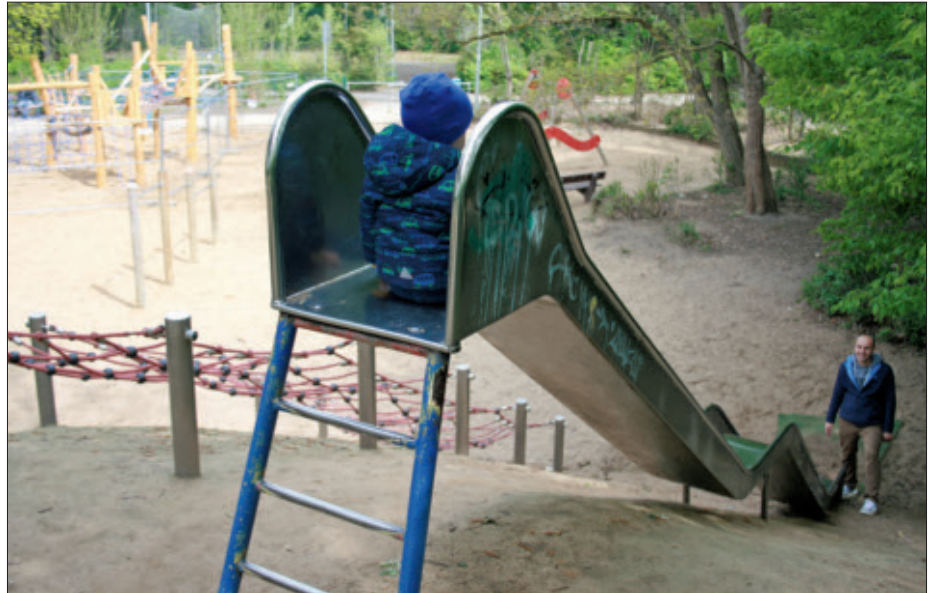
Der Spielplatz an der Kantstraße hat eine große Fläche und wird von vielen genutzt.

plätzen in Erfstadt werden von der Politik im Jugendhilfeausschuss entschieden. Sie waren