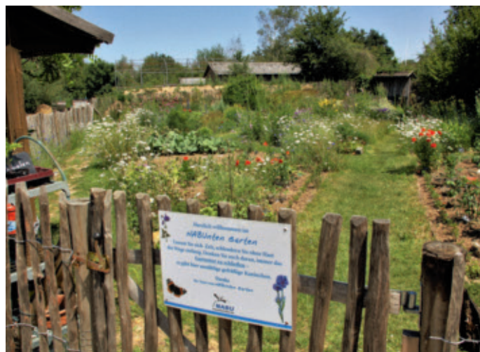
Im NABU Unten Garten im Umweltzentrum Friesheimer Busch wird es bald wieder brummen und summen

„Wir wollen einen großflächigen und ganzheitlichen Naturschutz erreichen. Die Nutzung der Natur darf nicht zur Ausbeutung werden. Die natürlichen Ressourcen dürfen nur nachhaltig ge-