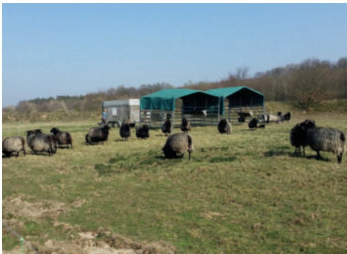
Zur Beweidung in der Landschaftspflegestation werden die genügsamen Heidschnucken eingesetzt

spielhaften Aktionen zeigen Experten notwendige Maßnahmen zum Erhalt wichtiger Lebensräume für Tiere und Pflanzen. Naturkundliche Wanderungen und Vorträge zu den vielfältigen Themen des Natur- und Umweltschutzes sollen für die Schönheit und den Wert der Natur sensibilisieren. Dingarten: „Besonders Kinder- und Jugendliche wollen wir motivieren, sich aktiv für Natur und Umwelt einzusetzen.“ Dazu sollen weitere Kinder- und Jugendgruppen im Rhein-Erft-Kreis aufgebaut werden. www.nabu-rhein-erft.de