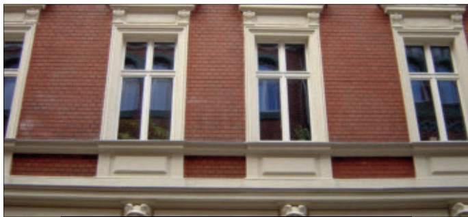
Beim Kauf einer Eigentumswohnung erwirbt man nicht nur den Wohnraum, sondern auch Rechte und Pflichten an gemeinsam genutzten Hausteilen, dem sogenannten Gemeinschaftseigentum.