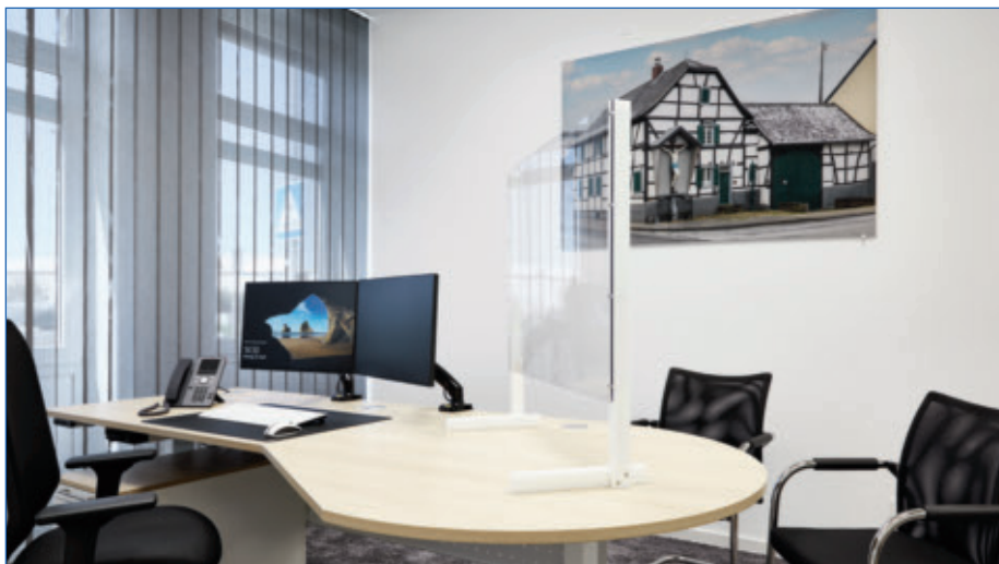
Alle Beraterzimmer wurden renoviert und modernisiert und ermöglichen eine diskrete Gesprächsatmosphäre.

Telefon 02233 9444-1400 Weitere Informationen erhalten Sie auf der Homepage: www.voba-rhein-erft-koeln.de