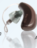
Abb. FLEX TRIAL

Hörsysteme sind heute so klein und unscheinbar, dass man sie kaum wahrnimmt. Technisch auf höchstem Niveau bieten sie einen optimalen Tragekomfort, der es Ihnen erlaubt, sich schon nach kurzer Zeit an Ihr Hörgerät zu gewöhnen. Mit unserem Hörsystem FLEX TRIAL können Sie bei uns jederzeit testen, was Sie wirklich benötigen und wie unnötige Kosten vermieden werden können.