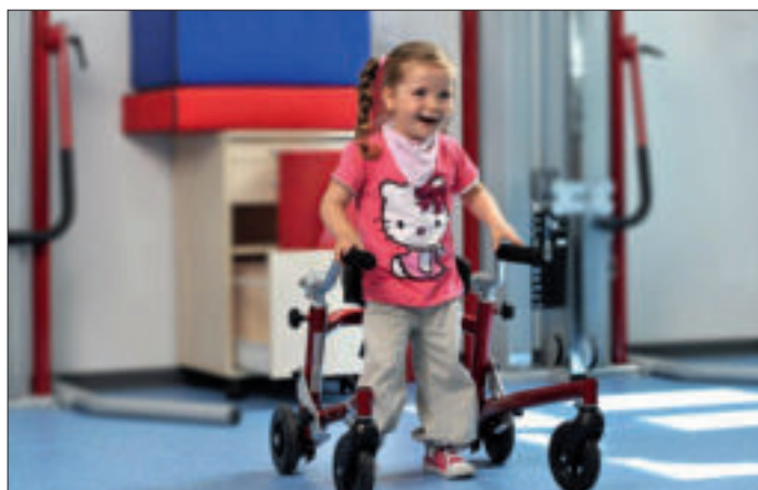
Auch eine Gehhilfe kann motivieren

Spendenkonto: Reha-Kids-Köln e.V. Kreissparkasse Köln IBAN: DE81 3705 0299 0119 2778 18