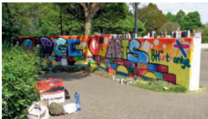
Unter dem Motto „The Bridge of Arts“ fand im Mai der einwöchige Schüleraustausch zwischen dem ASG und der Partnerschule von Burhaniye statt

Burhaniye ist eine türkische Kreisstadt in der Provinz Balıkesir an der Ägäisküste am Golf von Edremit gegenüber der griechischen Insel Lesbos. Seit der Kommunalreform 2012 sind Kreis und Stadt Burhaniye eine Verwaltungseinheit mit rund 58.000 Einwohnern. In den Sommermonaten kommen noch die primär türkischen Touristen dazu. Zwischen den Gebirgszügen des Ida im Norden und des Madra im Süden gelegen und bewässert vom Fluss Havran ist die flache Küstenebene sehr fruchtbar. Bekannt ist Burhaniye durch seinen Olivenanbau. Darüber hinaus wird der Ort überwiegend durch den Tourismus geprägt, hier vor allem im am Meer liegenden Ortsteil Ören. Der weite Sandstrand trägt das Gütesiegel der Blauen Flagge der Stiftung für Umwelterziehung. Glücklicherweise wurde hier