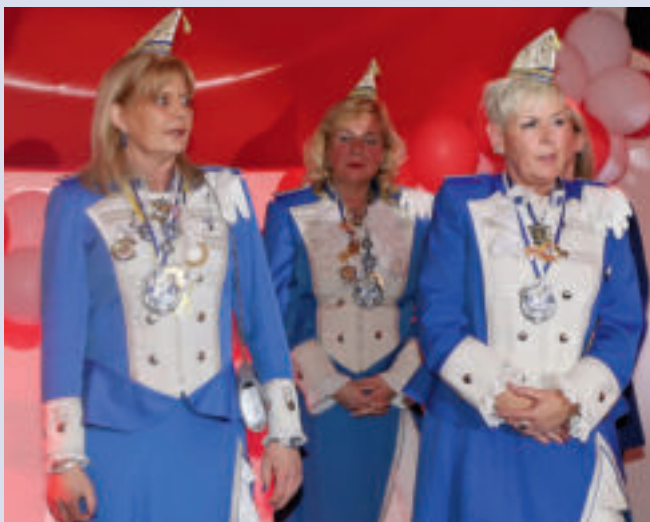
Das Damendreigestirn 2021 aus den Reihen der Funken Blau-Weiß