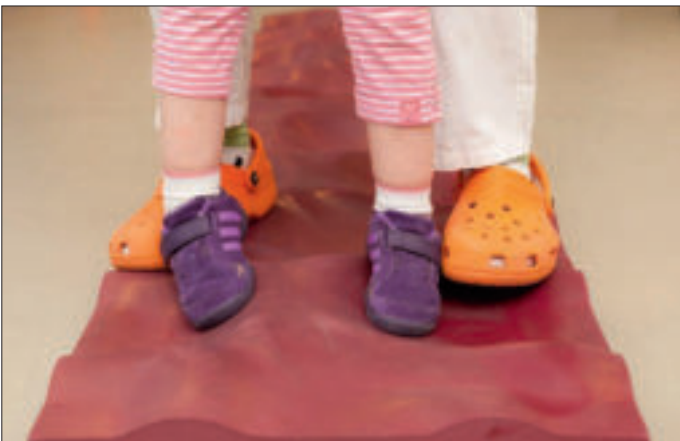
Eine Matte für das Gleichgewicht