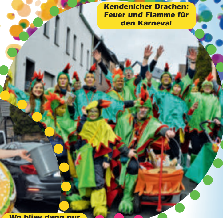
Kendenicher Drachen: Feuer und Flamme für den Karneval