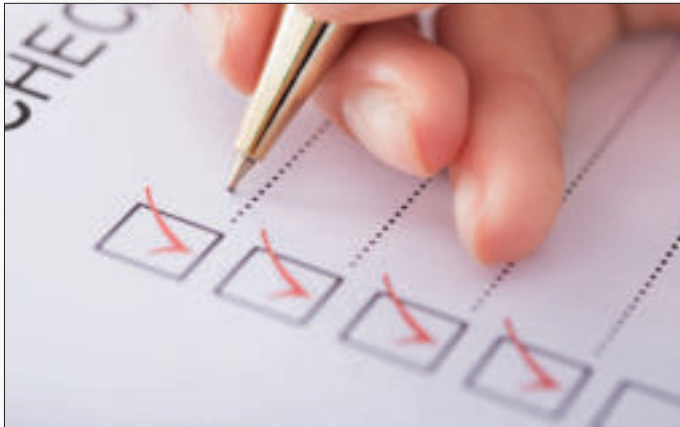
An alles gedacht? Eine Checkliste trägt dazu bei, dass man beim Grundstückskauf alle wichtigen Punkte beachtet hat.

1. Angehende Bauherren sollten prüfen, ob sich auf dem avisierten Grundstück der Bauwunsch um-