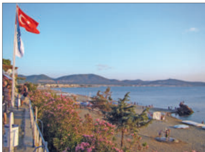
Die weiten Sandstrände von Burhaniye laden zum Badeurlaub ein

Seit 2011 pflegt die Stadt Hürth die Städtepartnerschaft mit dem türkischen Burhaniye. Die herrlichen Sandstrände, die blaue Ägäis und die nahen Ruinen antiker Städte machen den Küstenort zum beliebten Sommerdomizil türkischer Touristen. Trotz der politischen Entwicklung bleibt die partnerschaftliche Zusammenarbeit erhalten. ■ Heike Breuers