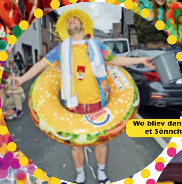
Wo blieb dann nur et Sönnche?