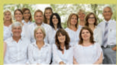
Über 30 Fachkräfte aus den Bereichen Medizin, Ernährung, Bewegung und Psychologie bilden das Expertenteam des SI Ernährungsinstituts in fünf Therapiezentren in Köln, Bonn, Siegburg und Bergisch Gladbach.

Neugierig geworden? Dann vereinbaren Sie jetzt Ihren kostenlosen Beratungstermin!