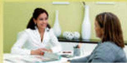
Finden Sie heraus, wie auch Sie Ihr Wunschgewicht erreichen können - unser gratis Abnehm-Check gibt Auskunft!