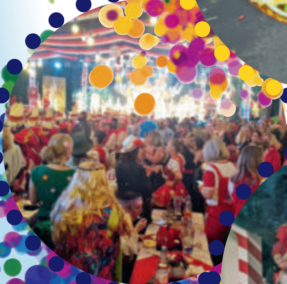
Auch in der kommenden Session: Top Acts in Gleuel