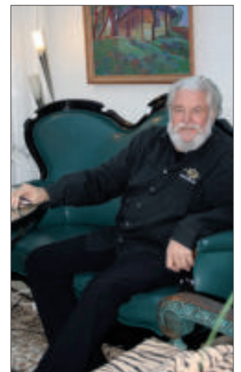
King Size Dick ist Botschafter der Reha Kids

Auch das Musikcorps Kölner Husaren Grün-Gelb, ein Kleingärtnerverein und die Kreissparkasse Köln unterstützen den Verein. Neben einer aktiven Mitgliedschaft gibt es noch vielfältige Möglichkeiten, den Kindern und Jugendlichen Freude zu bereiten und sich zu engagieren.