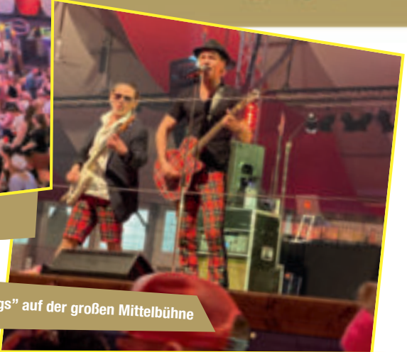
„Brings“ auf der großen Mittelbühne