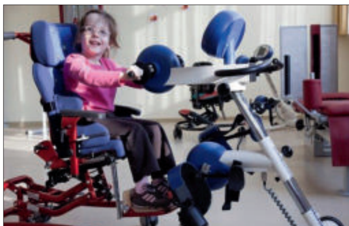
Muskelaufbau für Kids mit körperlichen Einschränkungen