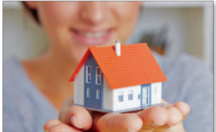
Damit sich die Familie später in den eigenen vier Wänden wirklich wohlfühlen kann, sollten alle Aspekte beim Grundstückskauf sorgsam geprüft werden.