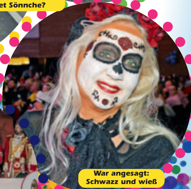
War angesagt: Schwazz und wieß